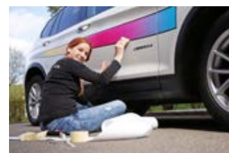
Distribution Montage Commissionnement