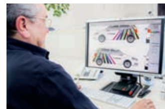
Conception graphique Prépresse