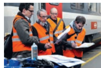
Conseil Gestion de projet Intégration de processus

Christinger vous offre des services individuels tout-en-un. Nous vous accompagnons de la création graphique et du traitement des données à la distribution en passant par la production. Cette vaste offre de services inclut une gestion de projet efficace, des processus de production standardisés ainsi qu'une intégration de processus automatisée.