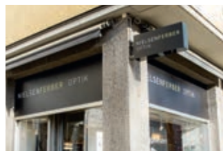
Marquage des bâtiments

Le marquage de votre identité graphique est une manière d'affirmer votre soutien à votre marque et de transmettre avec force votre message publicitaire. Le marquage total et partiel de flottes de véhicules, le marquage de bâtiments et la mise en place de signalétique sont techniquement ambitieux et réclament du doigté. Nos techniciens publicitaires posent et collent pour vous sur chaque support souhaité. Christinger est à l'aise autant dans le travail manuel classique qu'avec les nouvelles technologies.