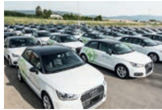
Marquage des flottes