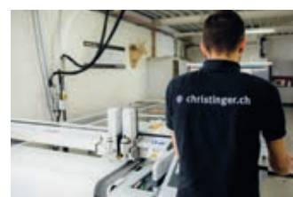
Production Fabrication en série Coupe