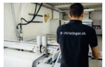
Produktion Konfektionierung Cut