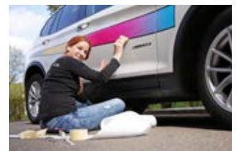
Distribution Montage Kommissionierung