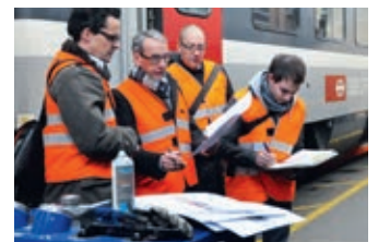
Beratung Projektmanagement Prozessintegration

Christinger bietet Ihnen individuellen Fullservice aus einer Hand. Wir begleiten Sie von der Grafikerstellung und Datenaufbereitung über die Produktion bis hin zur Distribution. Das erweiterte Dienstleistungsangebot umfasst das effiziente Projektmanagement, standardisierte Produktionsabläufe sowie eine automatisierte Prozessintegrationen.